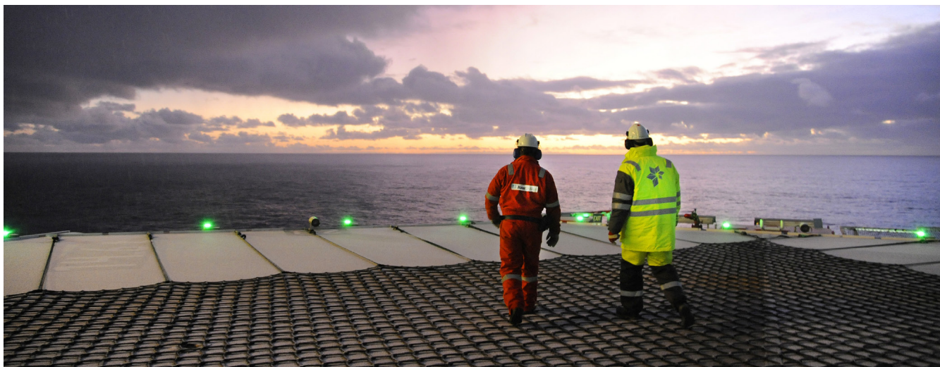
Leteriggan Aker Barents i Barentshavet.