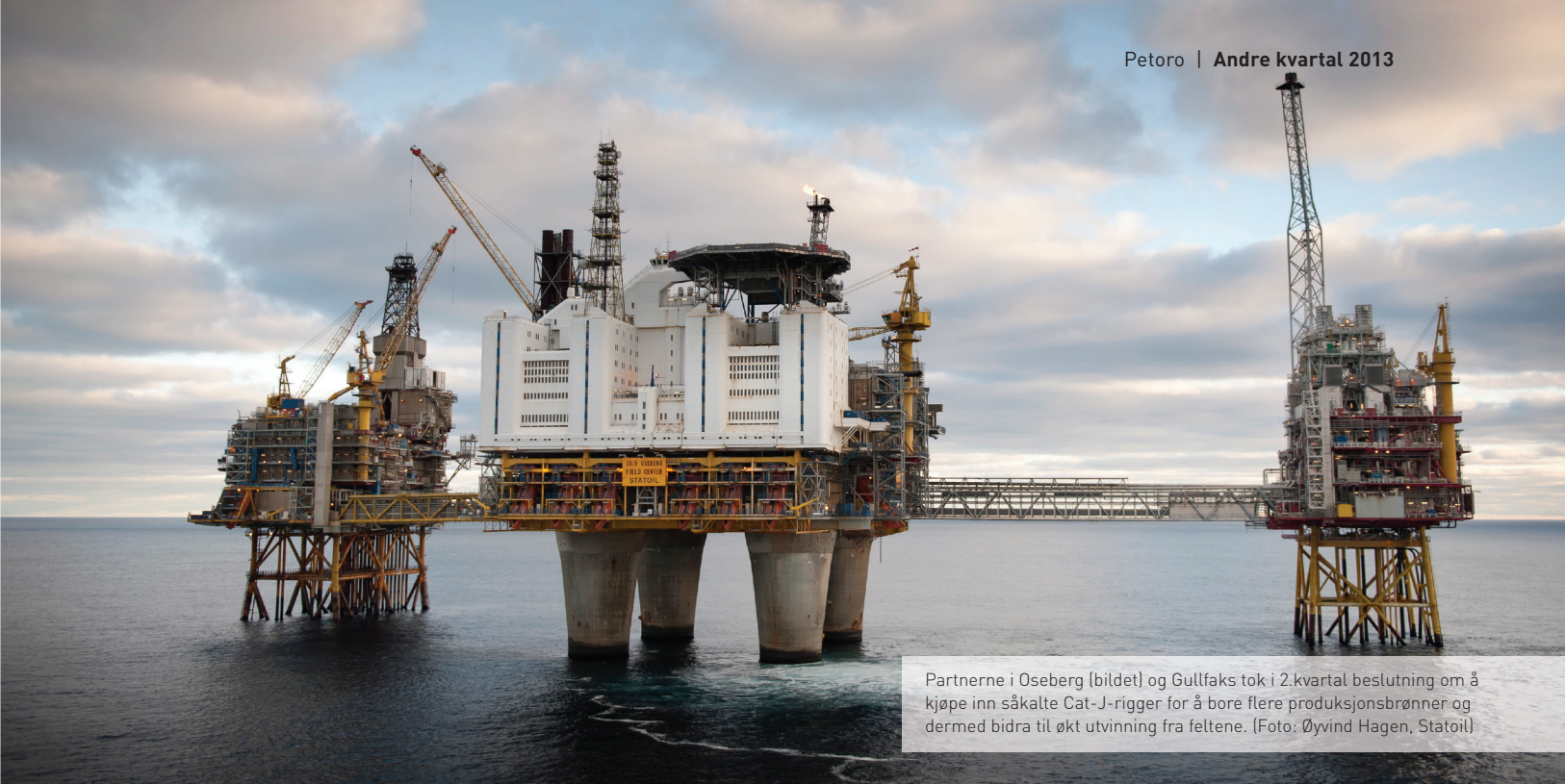
Partnerne i Oseberg (bildet) og Gullfaks tok i 2.kvartal beslutning om å kjøpe inn såkalte Cat-J-rigger for å bore flere produksjonsbrønner og dermed bidra til økt utvinning fra feltene.

Inntekter fra gassalg hittil i år var 15 prosent lavere enn i samme periode i 2012 som følge av lavere pris og volum. Per første halvår 2013 utgjorde de totale gassinntektene 45,4 milliarder kroner mot 53,3 milliarder for samme periode året før. Salgsvolumet av egenprodusert gass var per første halvår 18,35 milliarder kubikkmeter (Sm 3 ) eller 638 kboed mot 717 kboed i 2012. Gjennomsnittlig gasspris har vært 9 øre per Sm 3 lavere enn fjoråret.